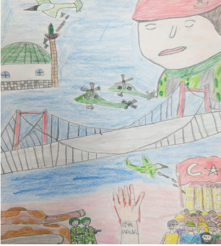
NURETTİN YAŞAR AKBIYIK / 2-A